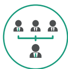
Verwaltung von Alleinarbeitern